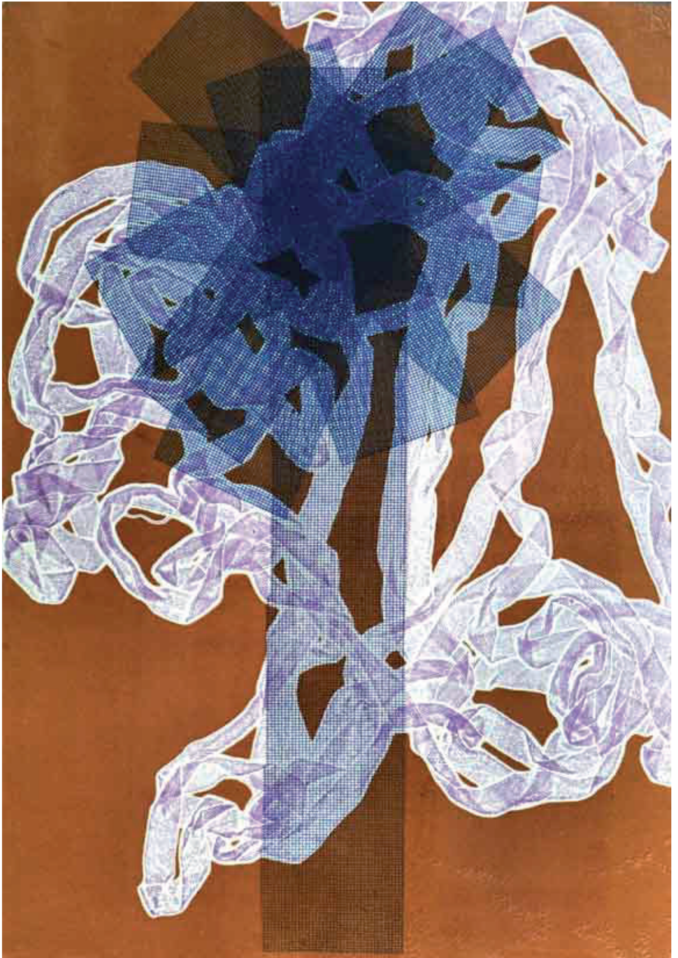
De la serie Permeables, monotipo. 2016