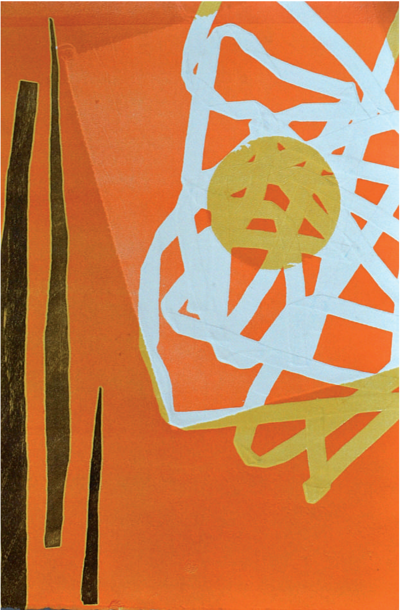
De la serie Permeables, monotipo. 2016