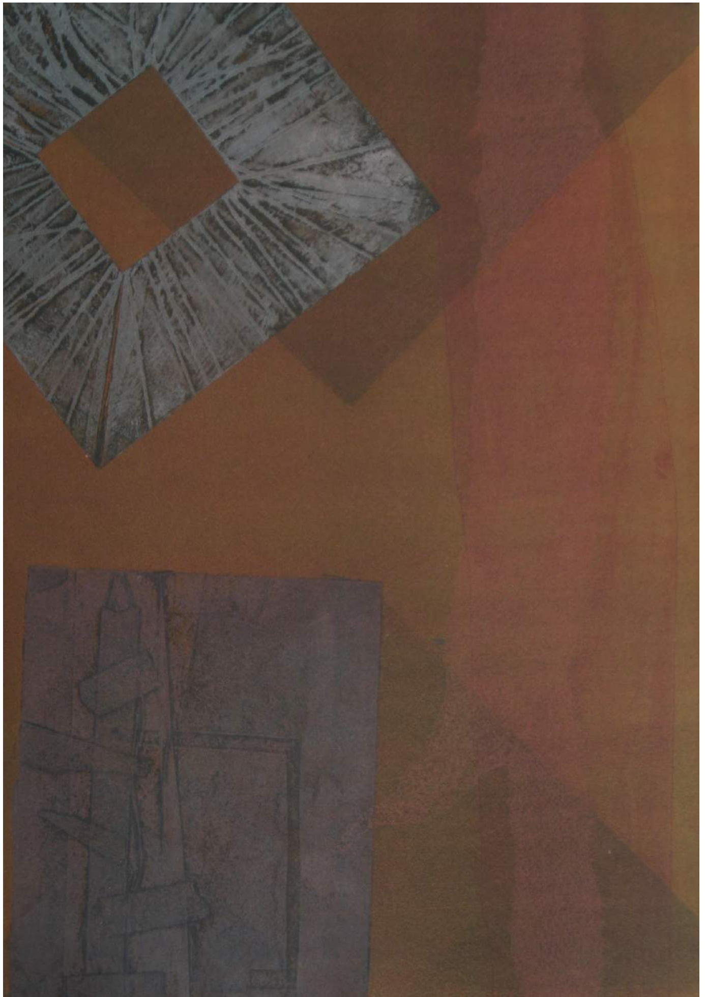
De la serie Permeables, monotipo. 2015