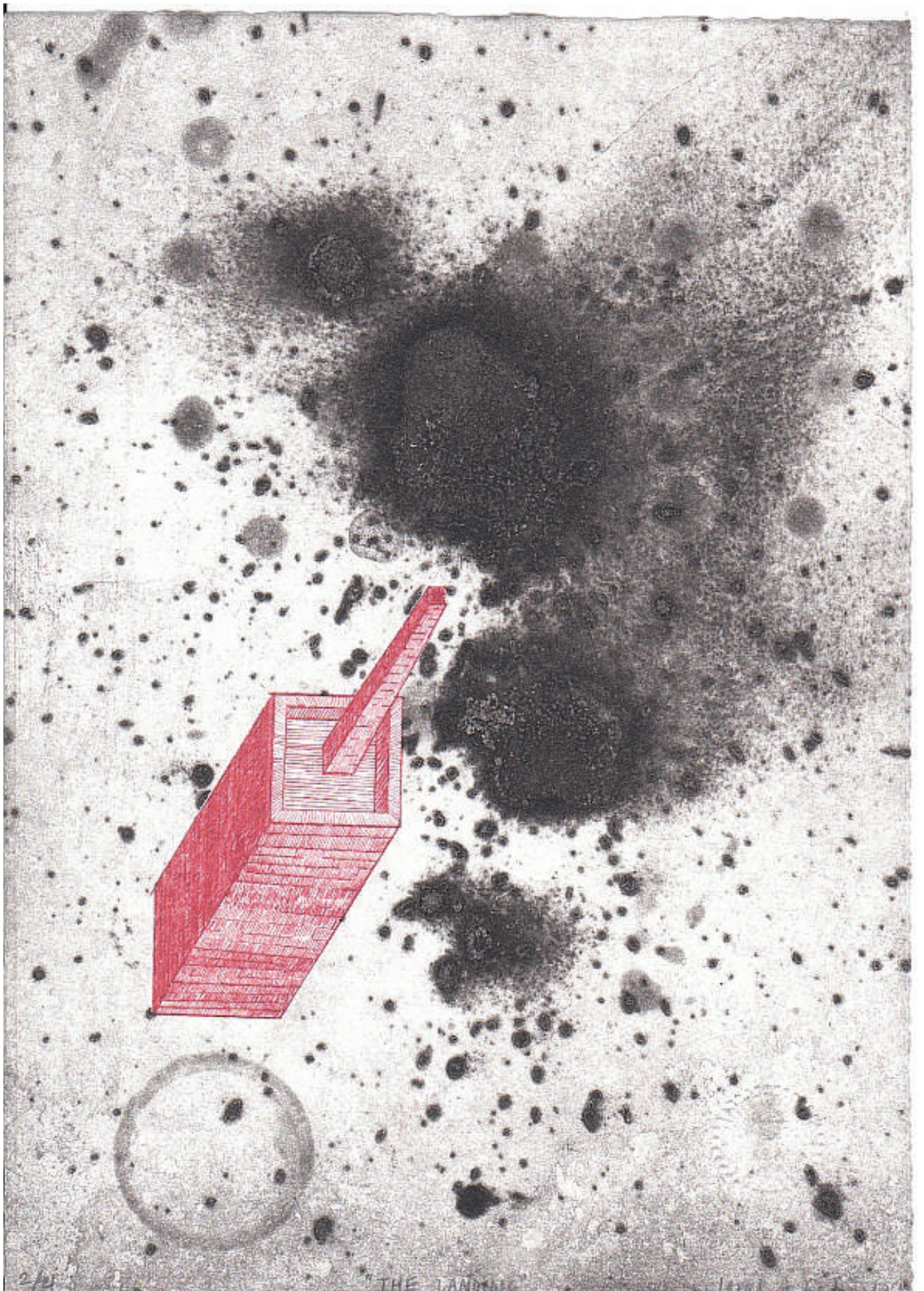
The landing, aguafuerte y aguatinta. 2010