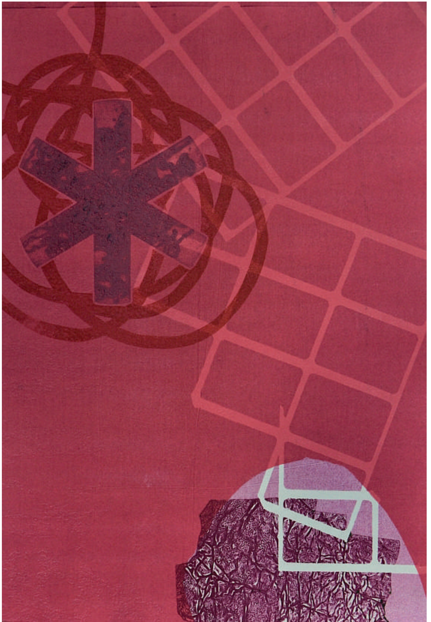
De la serie Permeables, monotipo. 2016