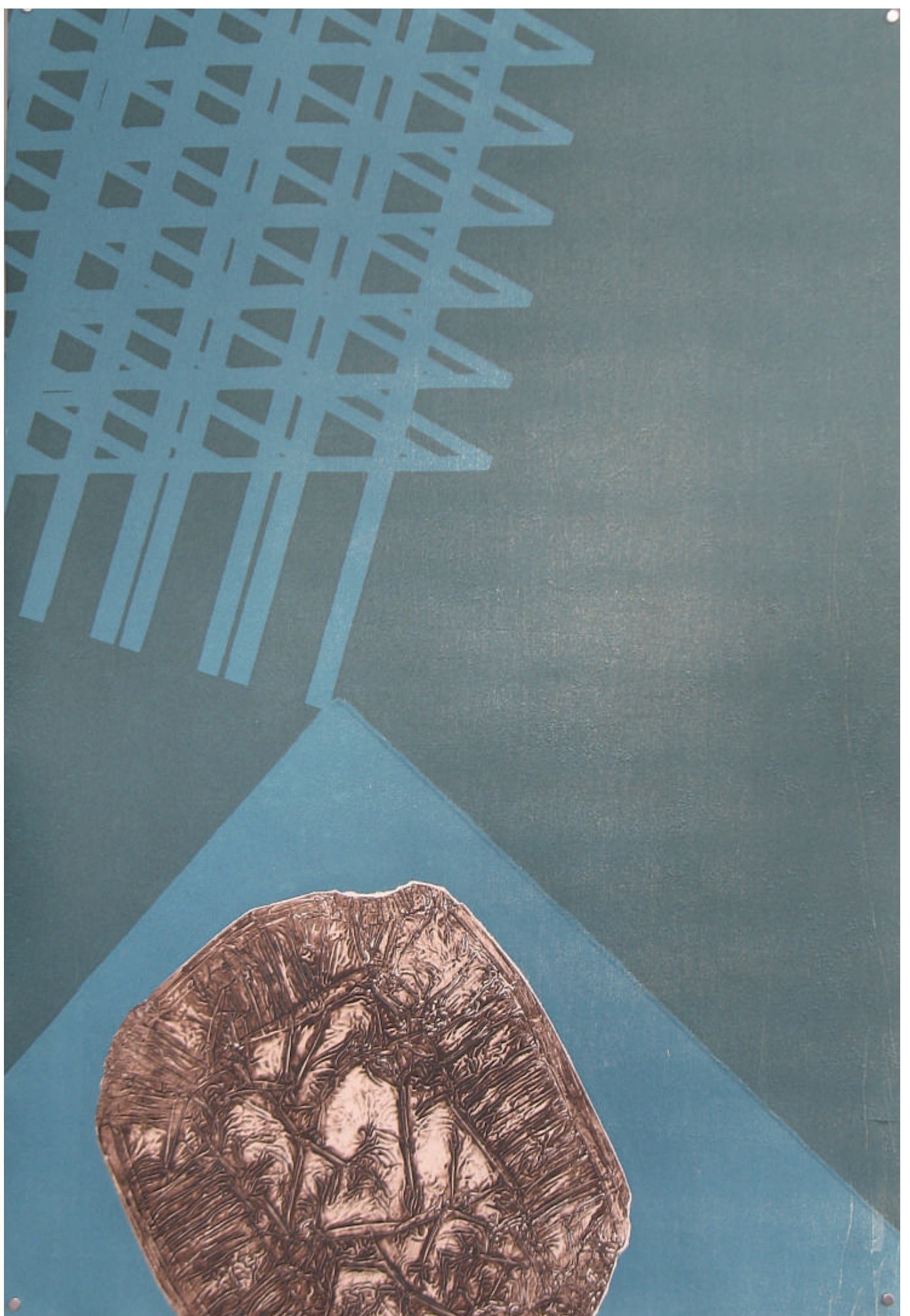
De la serie Permeables, monotipo. 2016