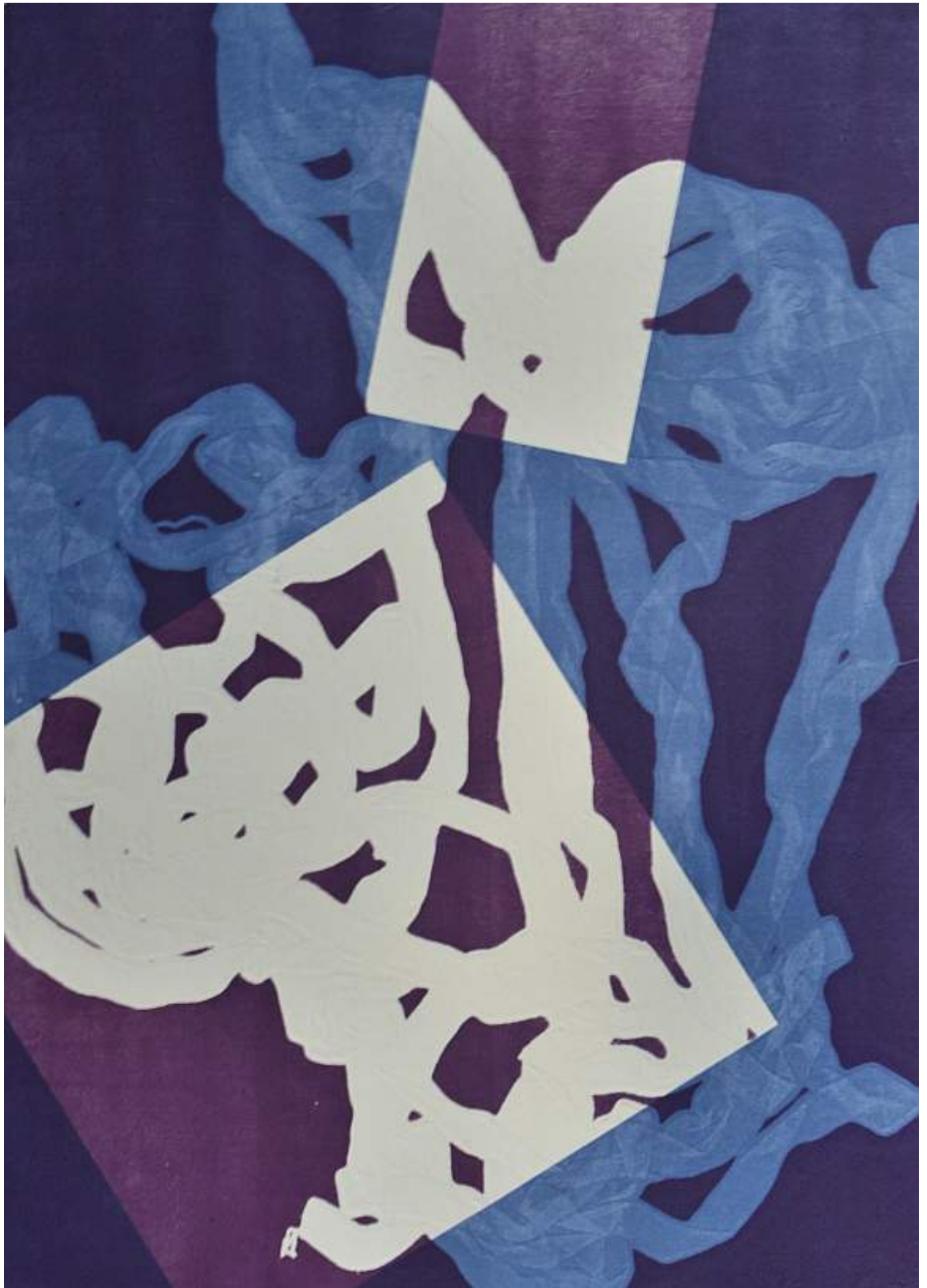
De la serie Permeables, monotipo. 2016